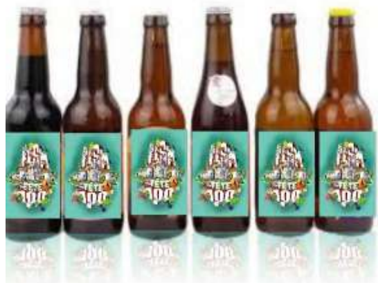
Pack 6 bières du Centenaire 33 cl