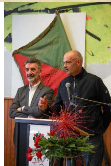
Quelques photos de la belle cérémonie de lancement de notre 100ème anniversaire